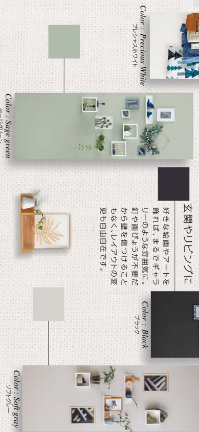
特注寸法 — 特別仕様 — 調整方法 — 施工上の注意 P.1104 納まり図 P.1248

玄関やリビングに 好きな絵画やアートを飾れば、まるでギャラリーのような雰囲気。釘や画びょうが不要だから壁を傷つけることもなく、インテリアの変更も自由自在です。