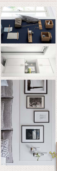
Color : Soft mauve ソフトマウブ

※磁石を貼り付ける場合は、必ずマグネター一期の接着剤を塗りつけてください。※設置できない場所があります。※詳細は P.202 ※施工例は、販売力の強い磁石を併用しています。