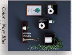
Color : Navy Blue ネイビーブルー

モノがごちゃごちゃしたトイレや洗面室もアクセントボードを設置すればスッキリマグネット付き小物を使って、おしゃれで便利な空間づくりを。